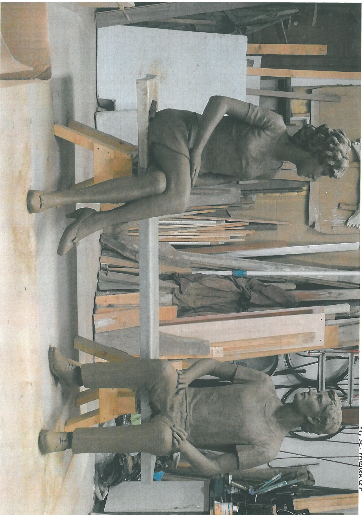
A, sz. melléklet