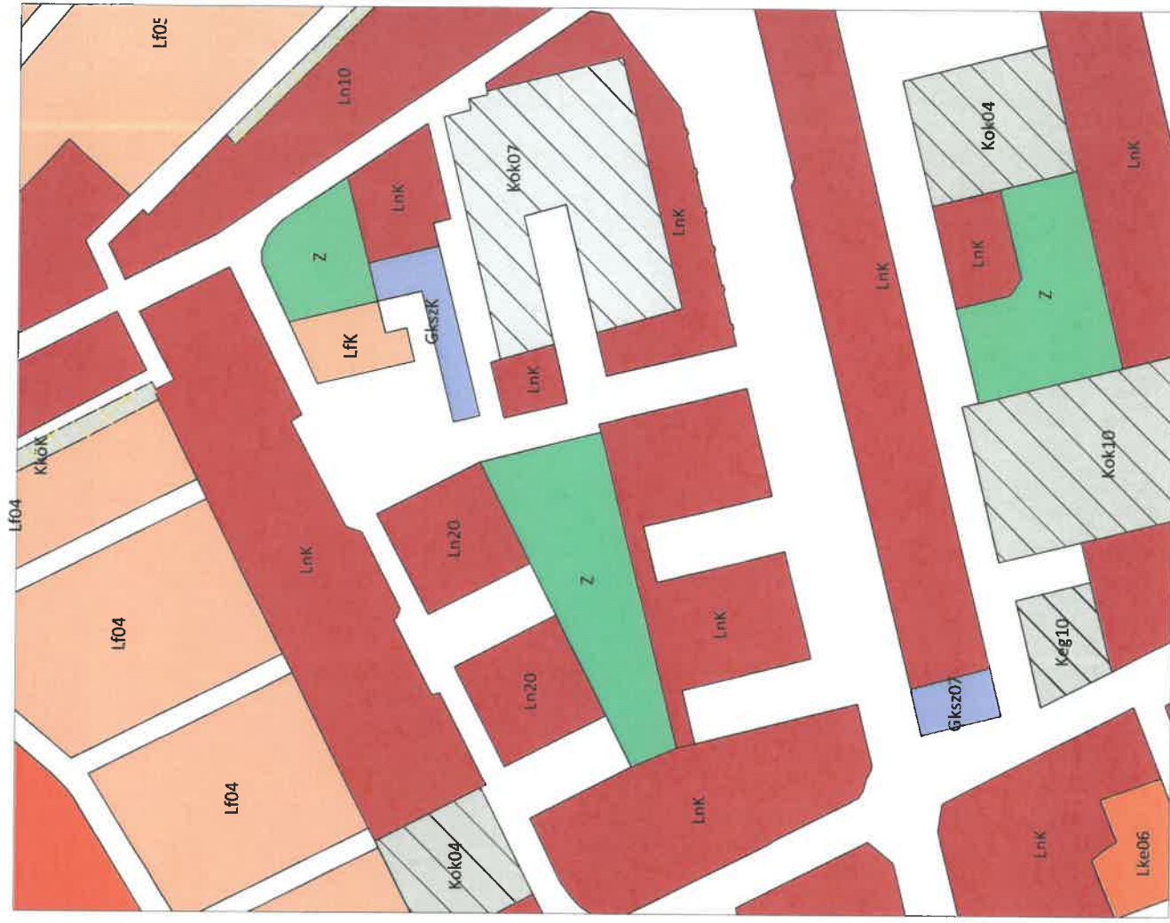
TSZTM 2022-005 Győr-Adyváros, Szigethy Attila és Török István utca közötti tömbbelső_szerkezeti fedvény