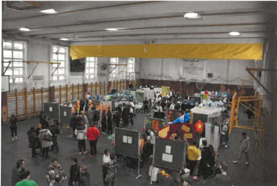
Tanirodai kiállítás 2023. december