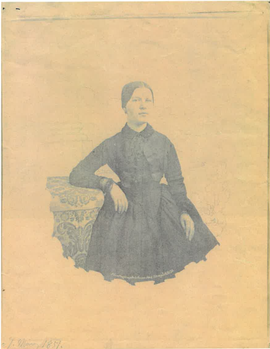
Ismeretlen nő fotója (1851. május 7.). Leltári szám: 6942