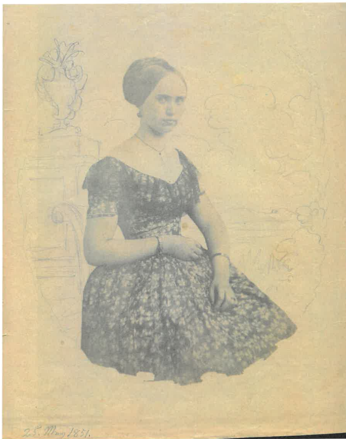
Ismeretlen nő portréja (1851. május 25.). Leltári szám: 6931.