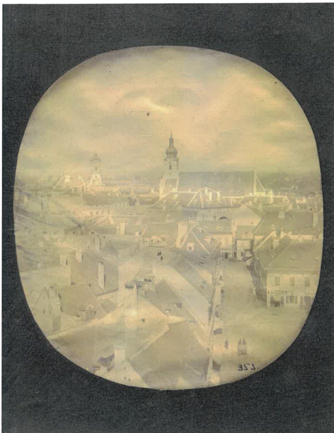
Látkép a győri tűztoronyból észak felé (1850-es évek): Leltári szám: 353.