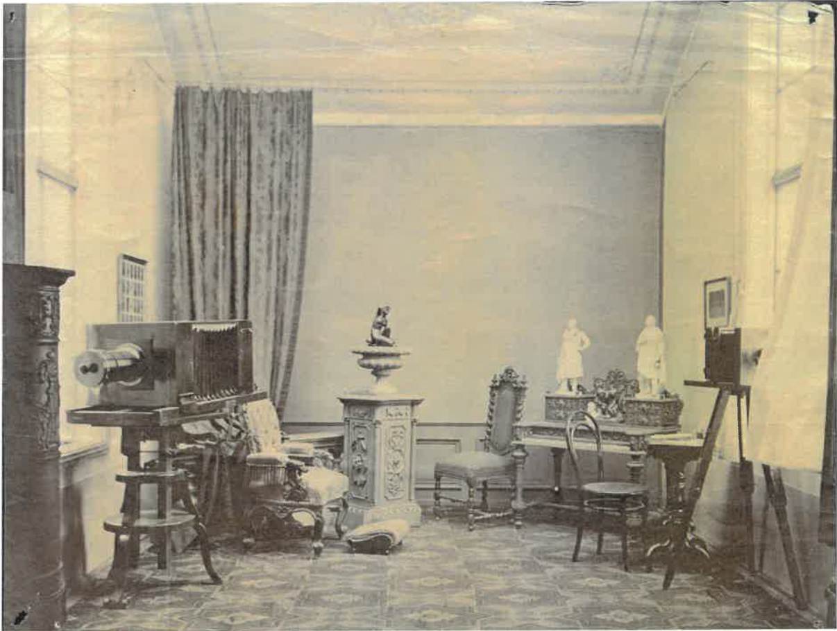
Skopáll József győri műterme (1860 körül). Leltári szám: 7059.