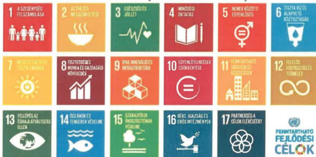
1.3. ábra: Fenntartható Fejlődési Keretrendszer 2030 céljai