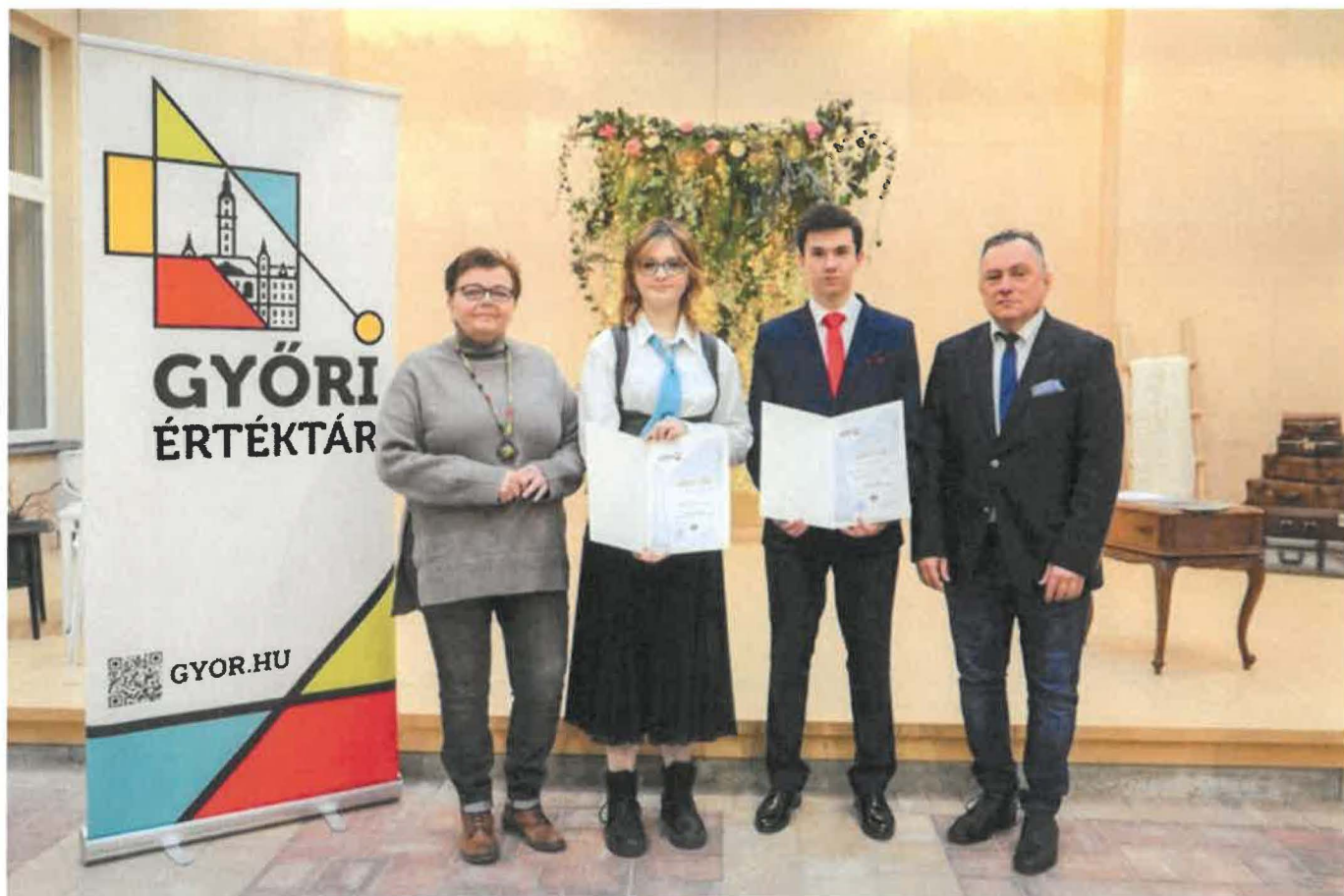
Győri Értéktár vándorkiállítás megnyitó 2024 februárjában a Generációk Művelődési Házában