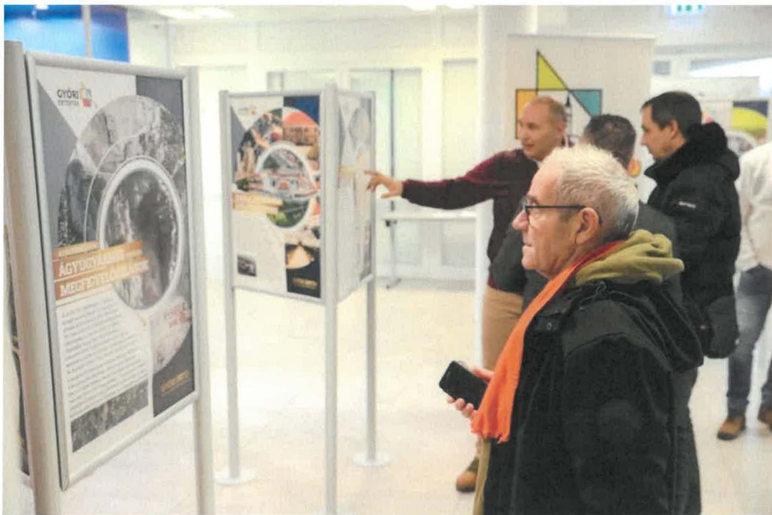
Győri Értéktár vándorkiállítás megnyitó 2024 decemberében, a Kiskút ligeti Műjégpálya – Győri Jég sport Központ aulájában