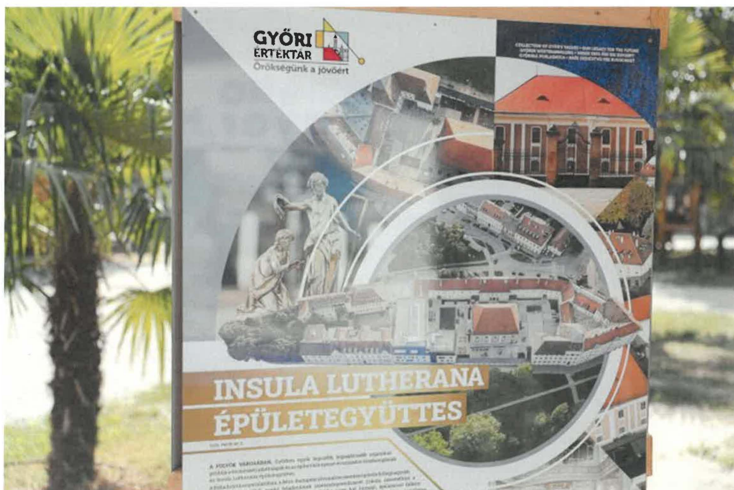
A Győri Értéktár vándorkiállítás egyes elemeinek kiállítása 2024 augusztusában a Xantus János Állatkertben