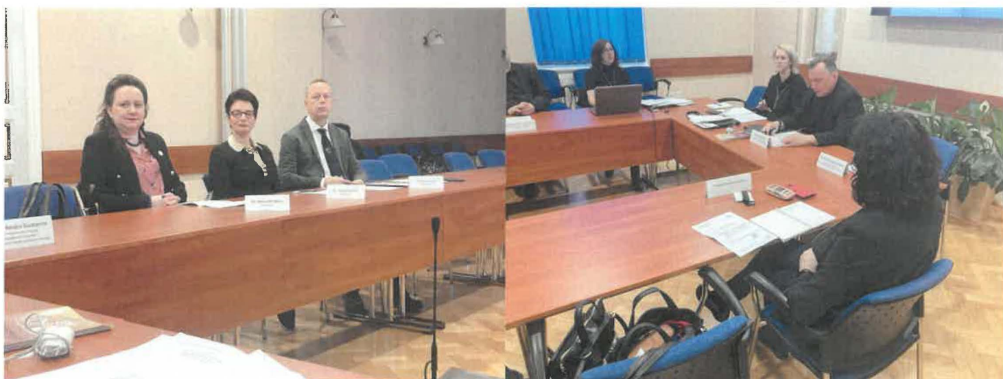
2024. március 7-i bizottsági ülés