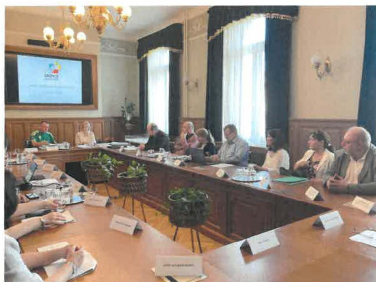
2024. május 23-i bizottsági ülés