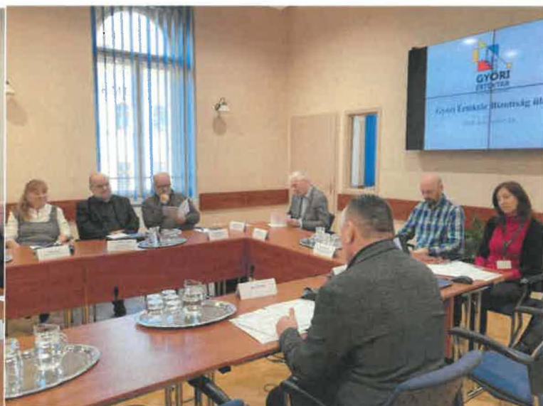
2024. november 21-i bizottsági ülés