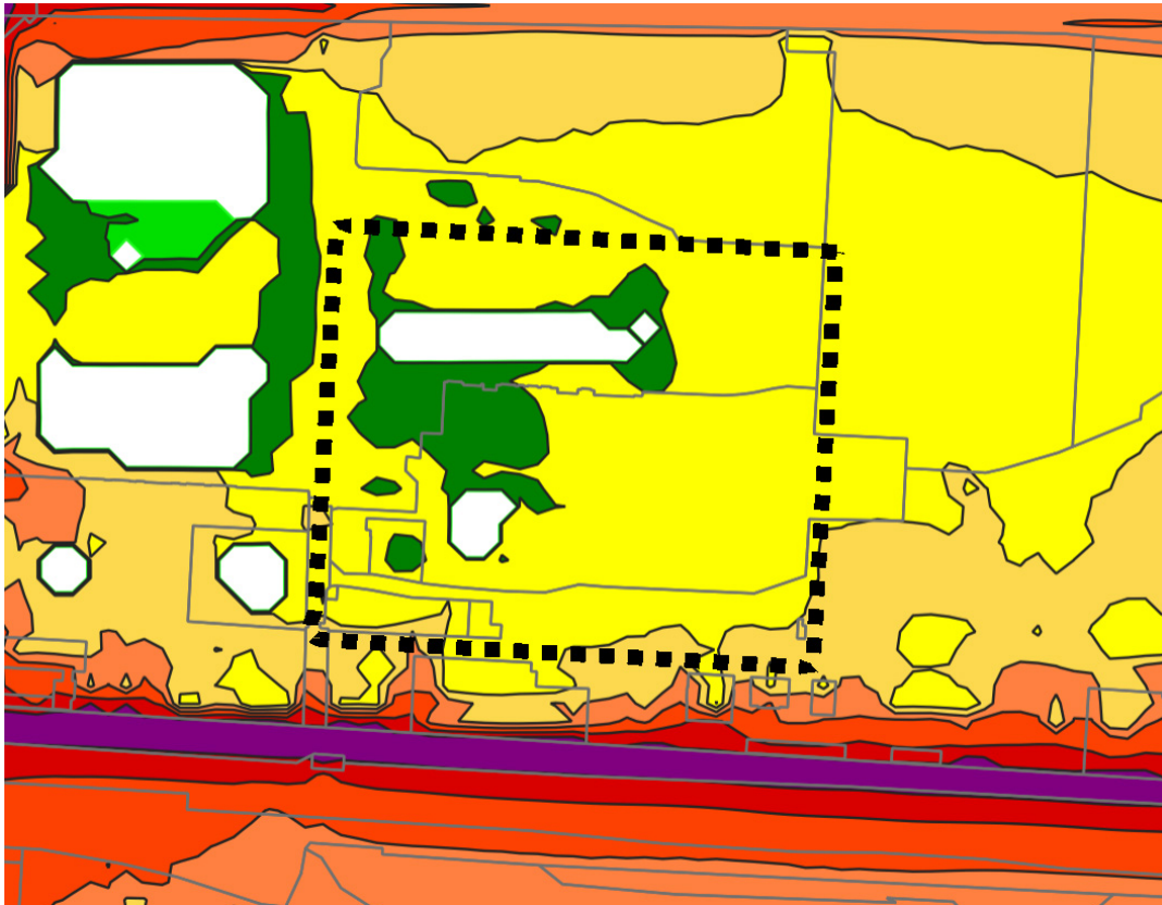
Közút zajterhelési térkép

A területhez legközelebb eső zajforrások a terület közelében futó közúthálózati elemek. A tervezési terület érintett közúti és vasúti közlekedésből eredő zajterheléssel, a fejlesztéssel érintett ingatlanok beépítését, külső határoló épületszerkezeteinek megválasztását ennek figyelembe vételével kell realizálni, illetve a tervezett fejlesztés során olyan passzív zajvédő műszaki megoldások alkalmazását javasoljuk, amelyek összességében biztosítják, hogy a jelenlegi zajterhelés ne nőjön.