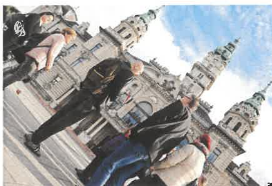
Múzeumi világnap 2025. május 18.