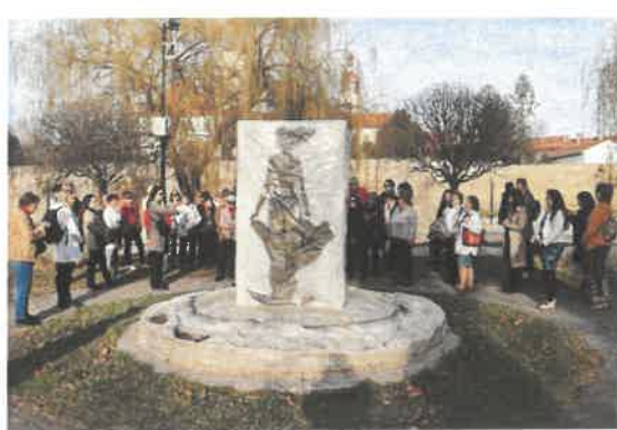
Emlékhelyek Napja 2025. május 10.