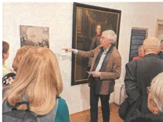
Egy kávé – egy festmény 2025. február – december